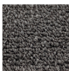
Tapis gris anthracite