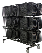
Chariot à chaises pliantes