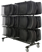
Silla plegable y carrito para árbol