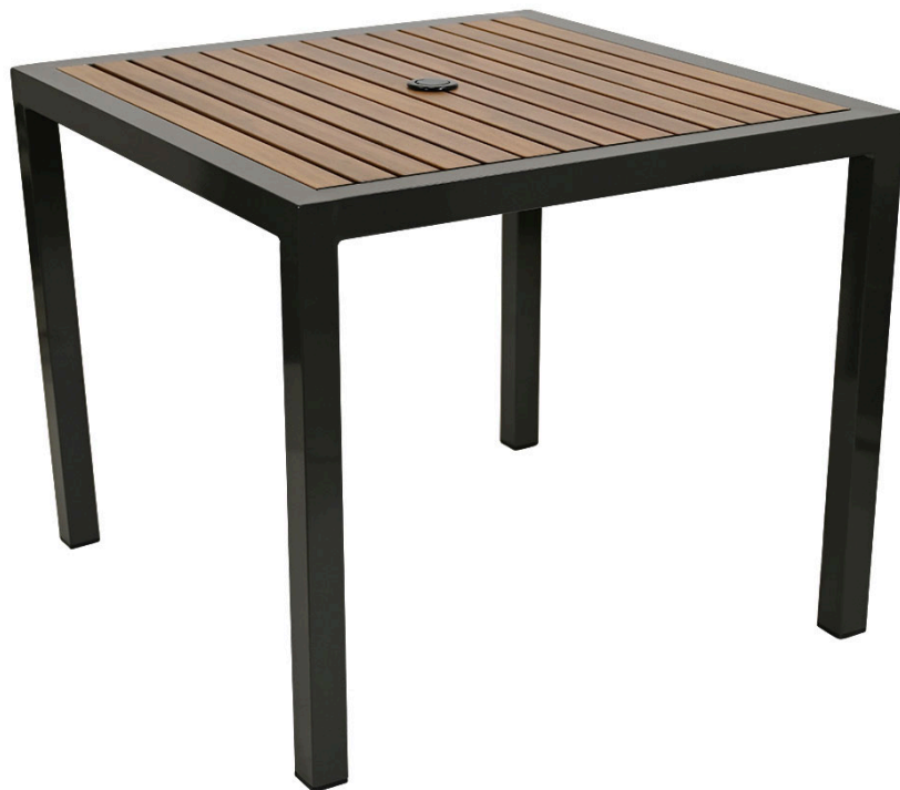
Table à manger Magnolia Square