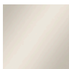
Grigio agata testurizzato