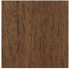
Alumawood di teak invecchiato