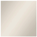
Grigio agata testurizzato