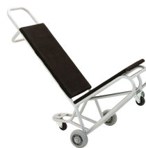
Carrinho PS com assentos confortáveis