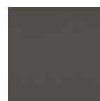
Areia de tungstênio