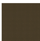
Veia de ouro