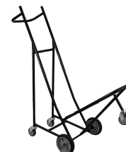
Carrinho com assento confortável de 5 rodas