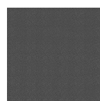
Veia de prata