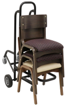
Carrello con sedia in legno