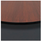
Caoba / Negro