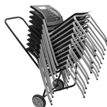
Adaptar a Dolly.