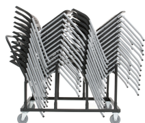
Carro para sillas adaptables