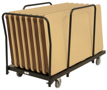
RT Cart – Edge