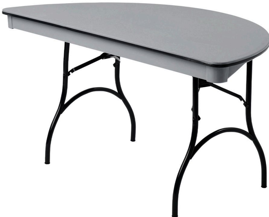
Table demi-ronde ABS