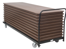
RT Cart – Plat